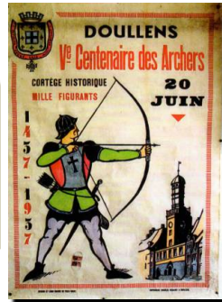
Bouquet de 1937